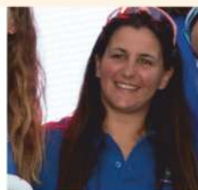
Caterina degli Uberti